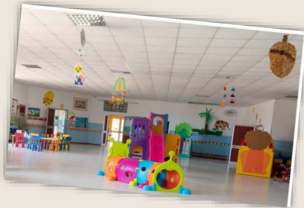
Νηπιαγωγείο «Πήτερ Παν»