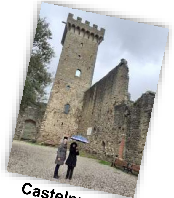
Castelnuovo Di Magra