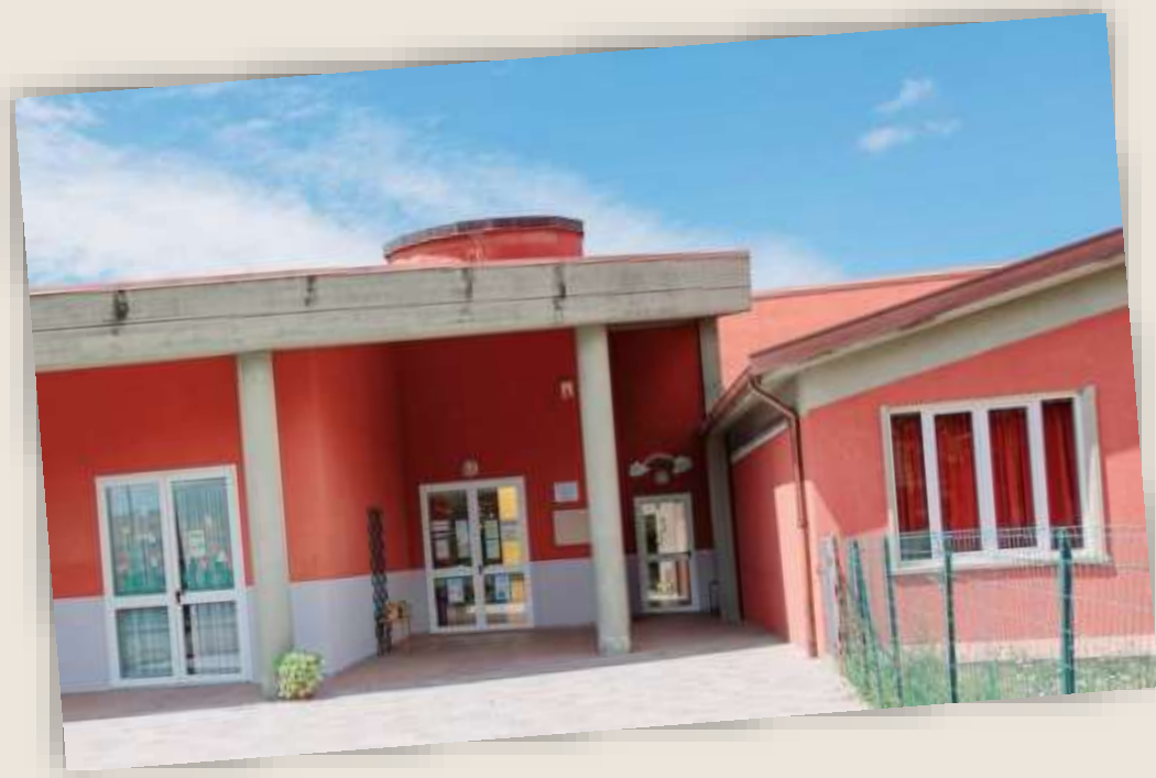
Νηπιαγωγείο «Ουράνιο Τόξο»

Στο κτιριακό συγκρότημα του Δημοτικού Σχολείου Castelnuovo di Magra στεγάζονται το Δημοτικό Σχολείο Κανάλε, το Δημοτικό Σχολείο Παβλοτρήσιας, τα Νηπιαγωγεία «Ουράνιο Τόξο» και «Πήτερ Παν» καθώς και ένα Γυμνάσιο.