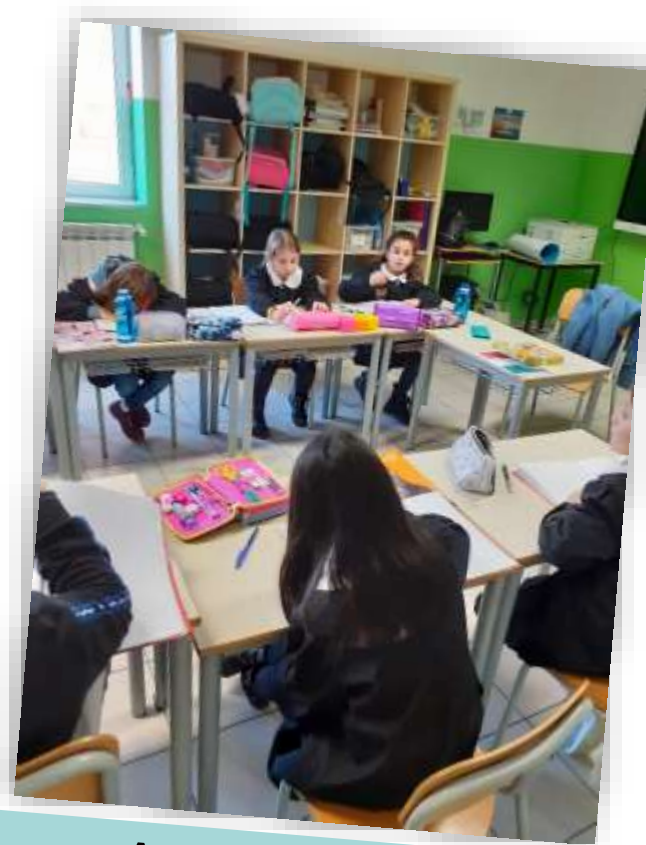
Δημοτικό Σχολείο Παβλοτρήςιας Ιταλική Λογοτεχνία Γ' τάξη